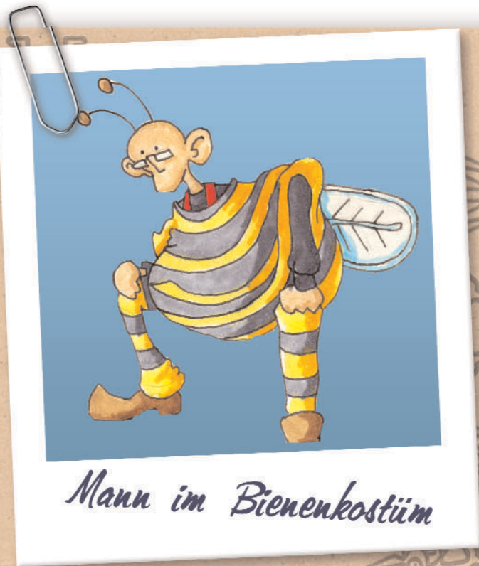
Mann im Bienenkostüm

Der Mann im Bienenkostüm leidet an einer Krankheit, die erneut beweist, dass das Schicksal einen Sinn für Humor hat: Eine chronische Überproduktion von Ohrenschmalz.