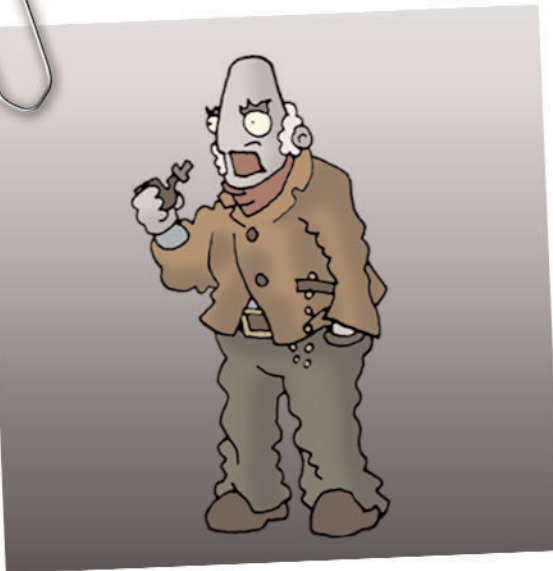
Dr. Horatio Marcel

Seit zehn Jahren versucht er nun, Edna ihren rebellischen Charakter auszutreiben. Sein Mittel: Die "Weisses-Papier-Methode". Doch Edna findet immer wieder einen Weg, sich an das Geschehene zu erinnern. Dieser Misserfolg ist ein Schandfleck im Lebenslauf des sonst so brillianten Psychologen.